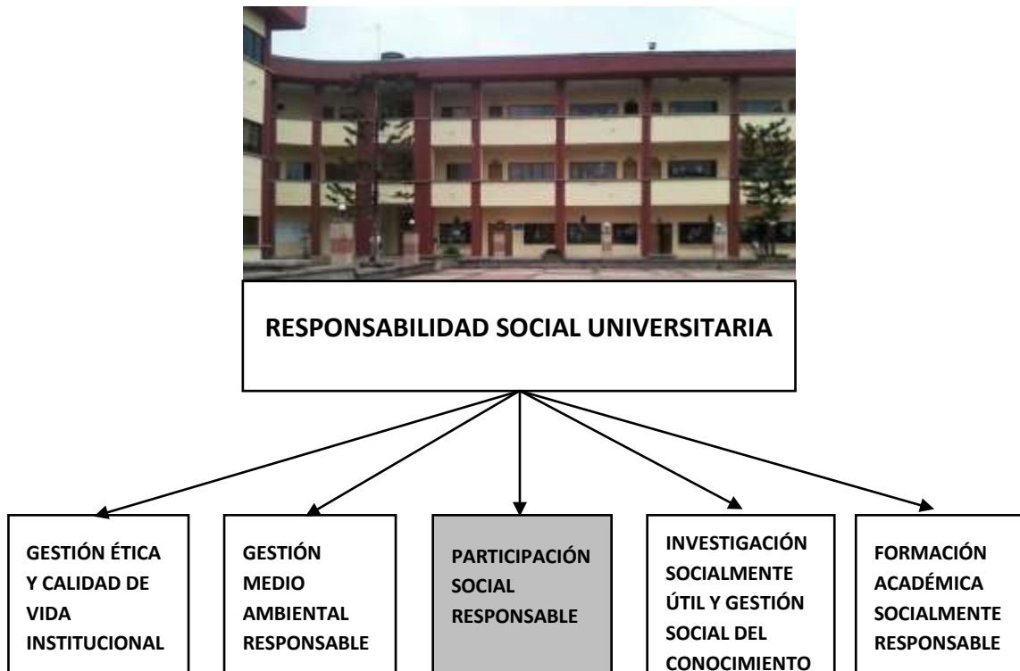
Figura 1: Procesos de la RSU

pertinentes; Participación social en promoción de un Desarrollo más equitativo y sostenible, ilustrados en el siguiente esquema: