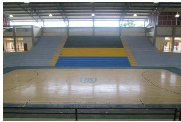
Coliseo Cubiero : Bloque No. 7