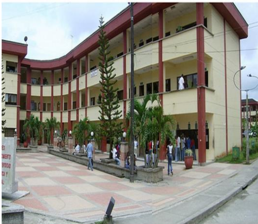
Bloque 1: Administrativo